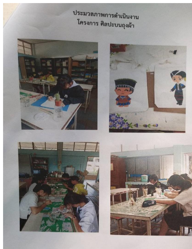
เงินอุดหนุน โครงการส่งเสริมคุณธรรม จริยธรรม นักเรียน โรงเรียนบ้านหัวนา